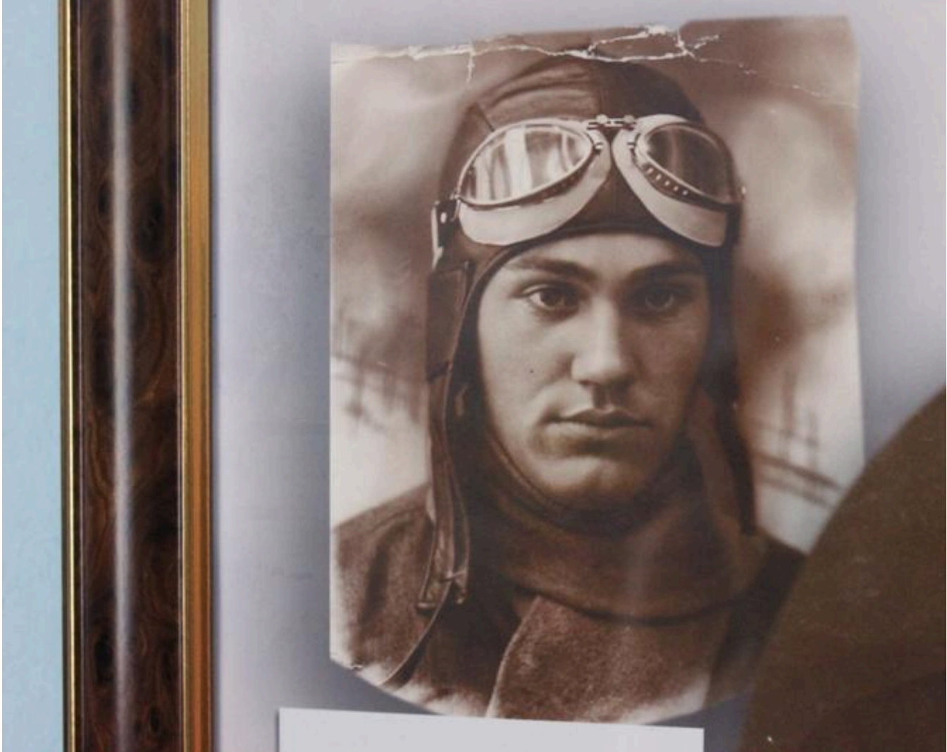
Фото 1. Молоді роки Петра Тронька. Роки II Світової...

Виставковий матеріал, що подається у меморіальній садибі-музеї академіка П.Т.Тронька, дозволяє прослідкувати зміни у світосприйнятті людини. Стають зрозумілими трансформації, що відбувалися у світогляді в залежності від об'єму знань та інформації, яка акумулювалася з віком.