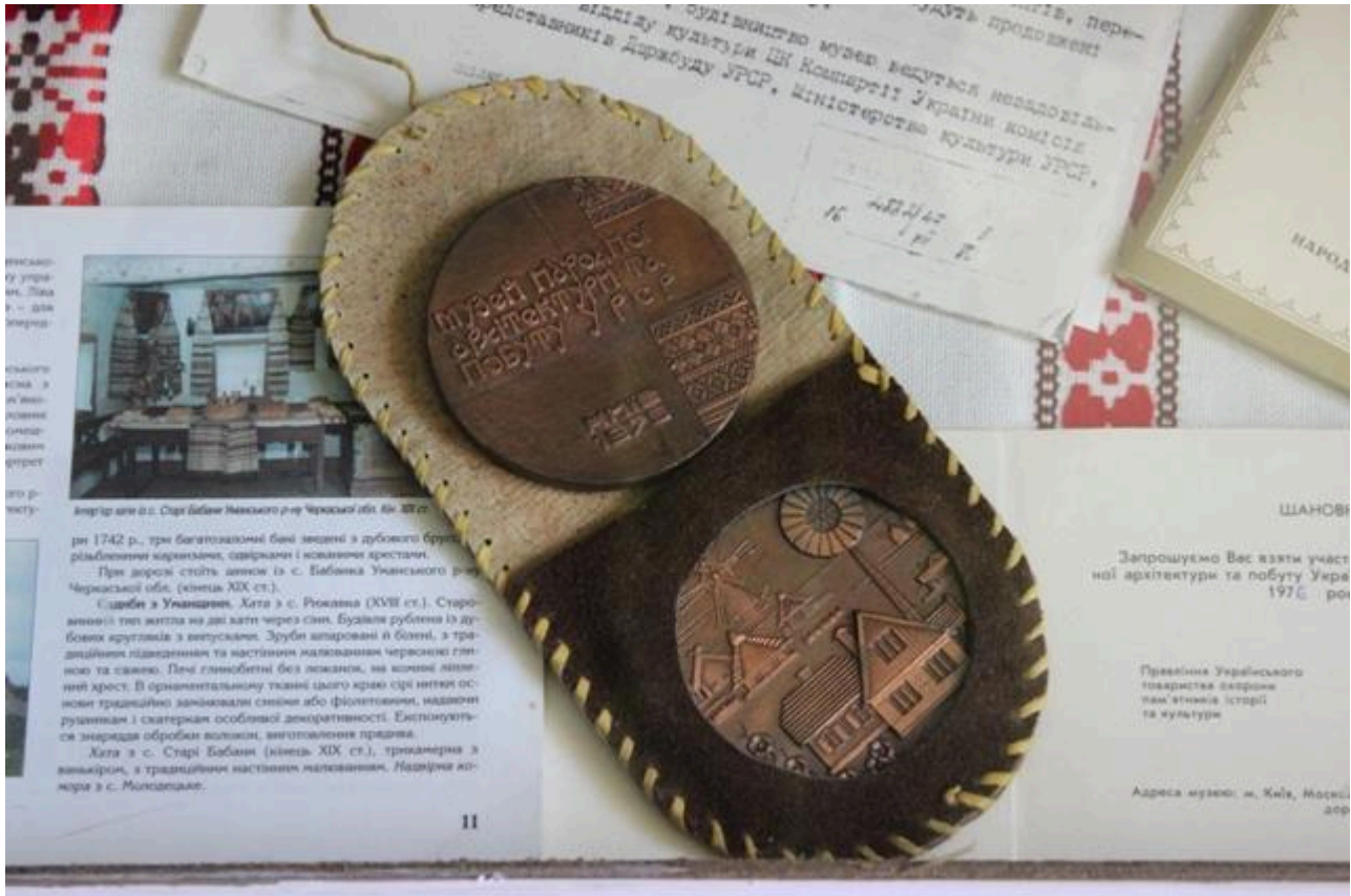
Фото 4. Експонати, пов'язані з відкриттям Національного музею народної архітектури та побуту України у 1976 році (тоді Державного музею народної архітектури та побуту УРСР).

прорахунки... Так , у розробленому проекті експозиції музею помітне замилювання патріархальною старовиною. Серед зібраних речей мало таких, які дають уявлення про класові суперечності та соціальну нерівність в українському дореволюційному селі.» [7].