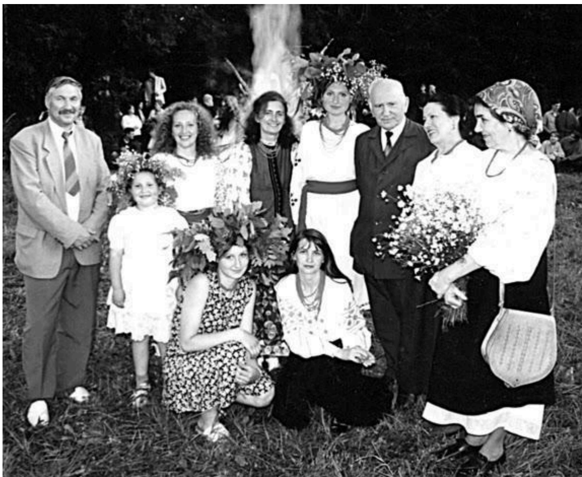
Фото 5. Музейне свято «Івана Купала». П.Т.Тронько у колі вірних друзів – науковців.

Відвідувачі познайомляться з предметним світом, побутом жителів Харківської області, а також з особистими речами академіка та його родини. У експозиції представлені фото історико-культурних пам'яток, до створення і відродження яких був причетний Герой України П.Т.Тронько.