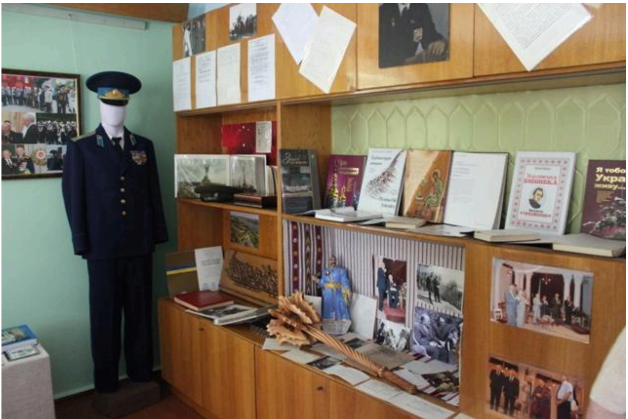
Фото 3. Військова форма П.Т.Тронька, унікальні фото та документи, книги з дарчими написами авторів та ін.

Академік Тронько зробив великий особистий внесок у міжнародне наукове співробітництво під час підготовки та проведення ІХ Міжнародного з'їзду славістів у вересні 1983 року. У меморіальній колекції вченого багато листів від колег з різних країн світу зі словами великої поваги і щирої дружби.