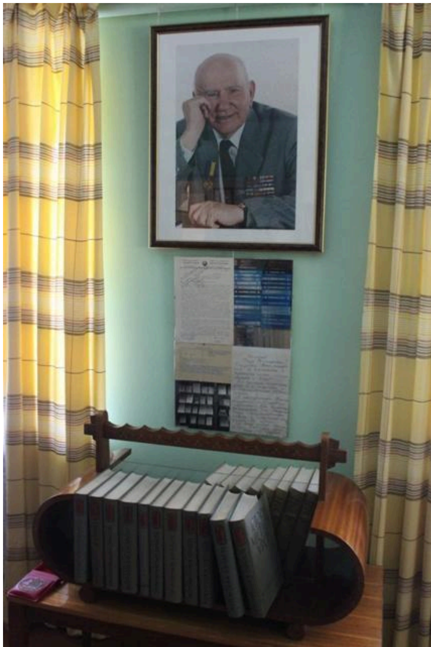
Фото 2. Герой України Петро Тимофійович Тронько. Документи та фото, пов'язані з унікальними виданнями. Серія книг «Історія міст і сіл Української РСР»

новий науковий напрямок – історичну регіоналістику, яка є симбіозом історичного, географічного, економічного, демографічного, соціологічного напрямку науки.