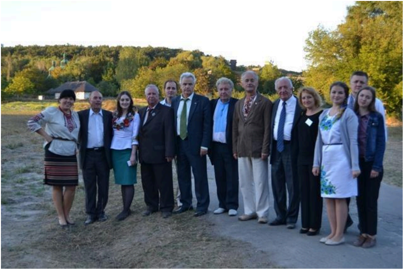
Фото 6. Учасники Міжнародної наукової конференції «Іван Франко у творенні української національної ідентичності», що відбулася у Національному педагогічному університеті ім. М.Драгоманова у вересні 2016 року.

У травні 2017 року в меморіальній садибі-музеї академіка П.Т.Тронька була відкрита виставка «Київщина ювілейна» до 85 річниці створення Київської області. Вона була створена за підтримки Державного обласного архіву Київської області. Останніми роками відбувся цілий ряд зустрічей краєзнавців у скансені. Таким чином, справа академіка Тронька продовжується у Національному музеї народної архітектури та побуту України.