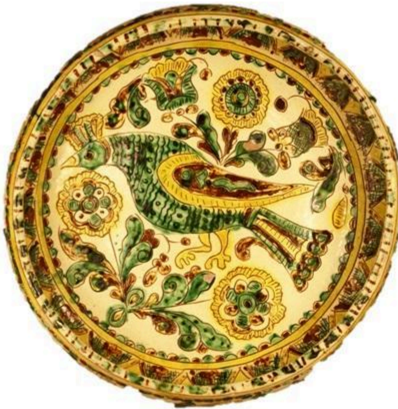
Рис. 6 Таріль настінна. Цвілик П.Й. МНАПУ КН-143/103 КС-695 Сер. XX ст. Глина, ангоб, розпис, випалювання.