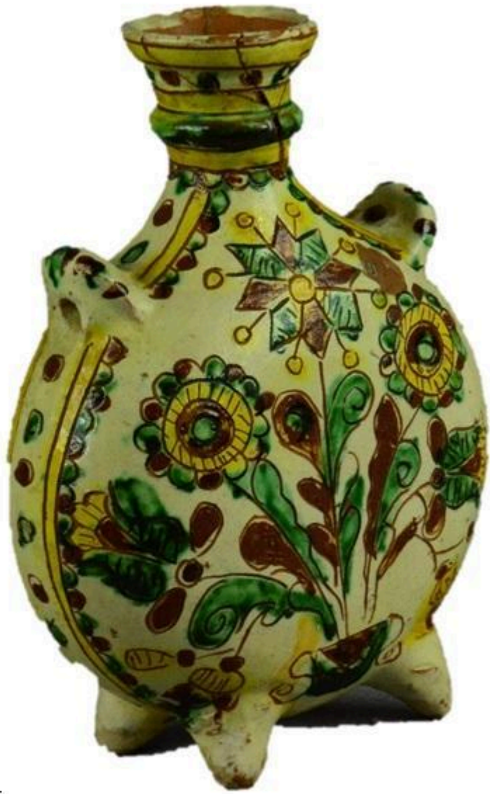
Рис.1 Баклажок. Цвілик П.Й. НМНАПУ КН-143/298 КС-749 Сер. XX ст. Глина, ангоб, розпис, випалювання