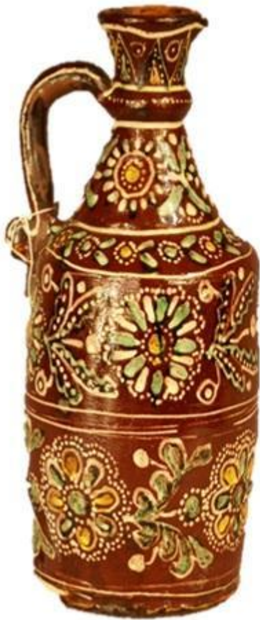
Рис. 16 Кавуш. Цвілик П.Й. НМНАПУ КН-143/132 КС-723 Сер. XX ст. Глина, ангоб, розпис, випалювання.

для орнаменту, який у цій роботі П. Цвілик виглядає ще більш яскравим та ажурним.