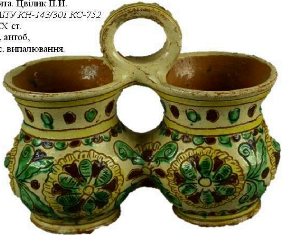
Рис. 11 Близнята. Цвілик П.Й. НМНАПУ КН-143/301 КС-752 Сер. XX ст. Глина, ангоб, розпис. випалювання.

Цікавим є таріль із поясом зображенням гуцула з люлькою в капелюсі та кептарі (НМНАПУ КН-141/104 КС-696) (Рис. 12). На берегах тарілки характерний для руки П. Цвілик ажурний стилізований рослинний орнамент з напівквітів, виконаний із точністю та вигадливістю.