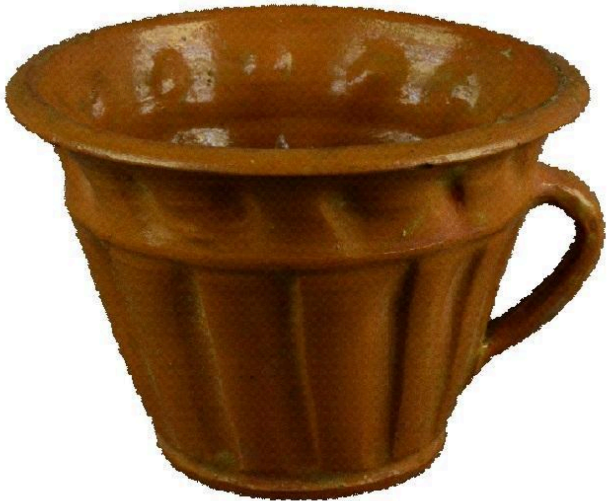
Рис. 18 Бабчер (пасківник). Цвілик П. Й. НМНАПУ КН-109/159 КС-3127 30-ті рр. XX ст. Глина, випалювання.

У фондовій колекції НМНАПУ також зберігаються скульптурні роботи П. Цвілик, які виконанні з тією ж майстерністю та художнім смаком, що особливо прослідковується в майстерному поєднанні форми виробів з їхнім орнаментальним оформленням. Приваблює форма й розпис декоративного баранця-підвазонника (НМНАПУ КН-143/158 КС-744) (Рис. 19). Уся поверхня баранця прикрашена казковим плетивом рослинних мотивів, серед яких особливо виділяються квіти з фантастичними пелюстками. Дрібні листочки, пуп'янки,