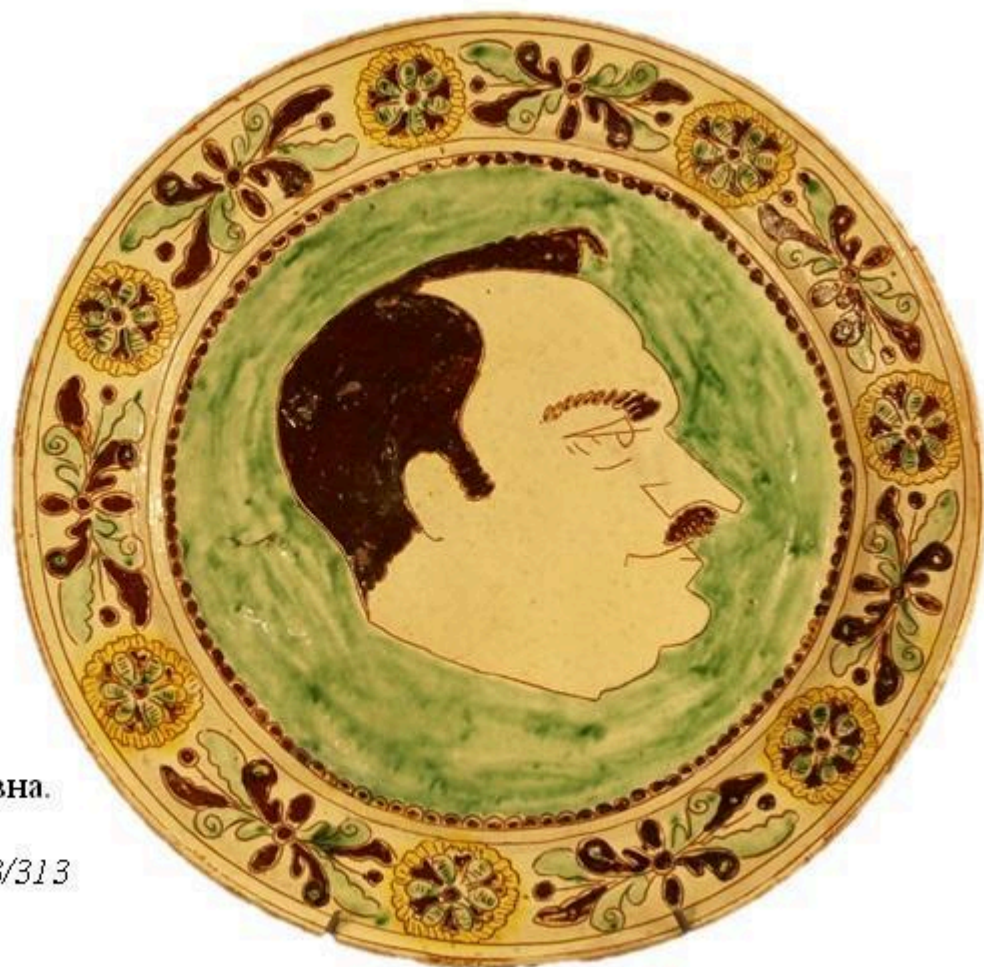
Рис. 13 Тарілка декоративна. Цвілик П.Й. НМНАПУ КН-143/313 КС-755 Сер. XX ст. Глина, ангоб, розпис, випалювання.