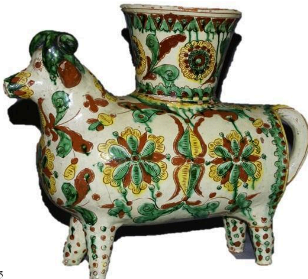
Рис. 5 Скульптура, баран-кашпо. Цвілик П.Й. НМНАІТУ КН-143/157 КС-743 Сер. XX ст. Глина, ангоб, розпис, випалювання.