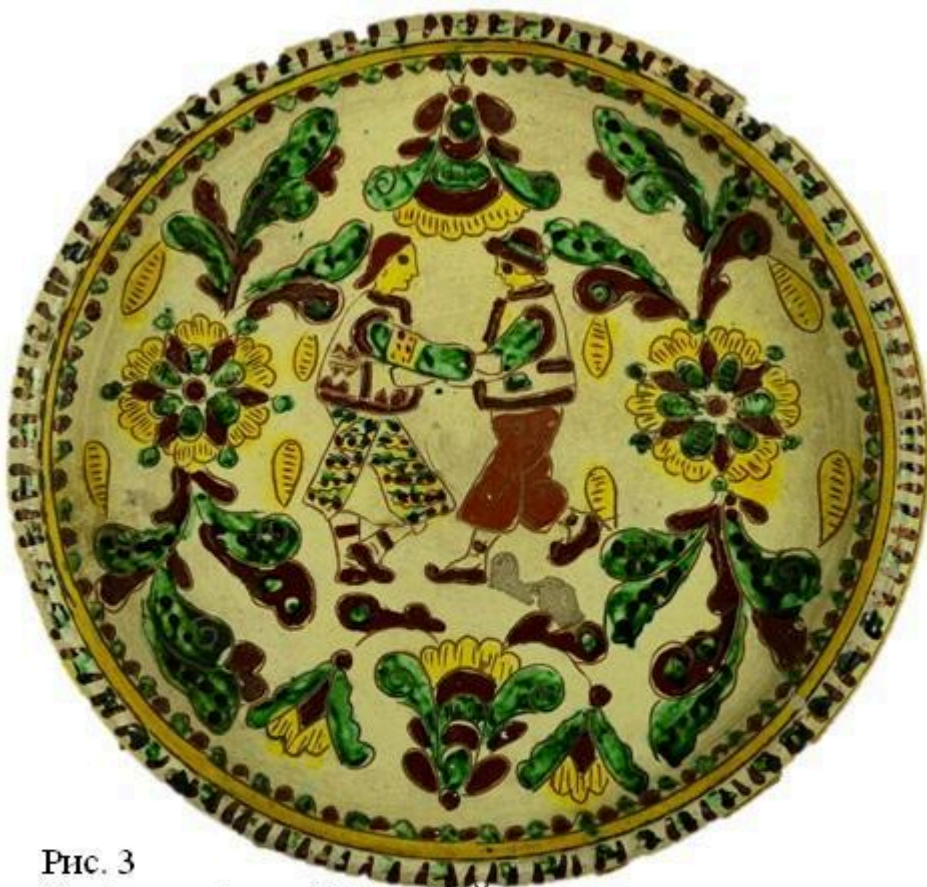
Рис. 3 Таріть настінна. Цвілик П.ІІ. НМНАПУ КН-143/102 КС-694 І пол. XX ст. Глина, ангоб, розпис, випалювання.

Приблизно в 20-х роках П. Цвілик створила майолікові сервізи для голландських художників, що відпочивали на косівському курорті. Ці сервізи склалися з тарелів, мисок, фруктівниць, навіть керамічних, розписаних традиційним гуцульським орнаментом кошиків для винограду [3]. Тоді ж майстриня почала працювати над розписом кахлів: застосовувала декоративні мотиви із сюжетними сценками, зображувала птахів, тварин, а особливу увагу приділяла композиціям із квітково-рослинними орнаментами (Рис. 3).