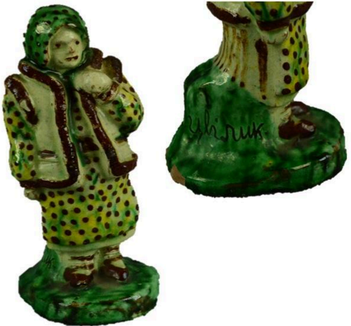
Рис. 4 Скульптура «Гуцулка». Цвілик П.І. НМНАІТУ КН-143/161 КС-745 Сер. XX ст. Глина, ангоб, розпис, випалювання.

У 1930-х роках на Гуцульщині з'явилося багато спекулянтів, які скуповували вироби в народних умільців, перепродували їх і добре на цьому наживалися. Ба більше, вони нав'язували майстрам міщанські смаки, що негативно впливало на розвиток народного мистецтва. Однак подружжя Цвіликів продовжувало залишатися вірними традиціям видатних гончарів Гуцульщини П. Баранюка, О. Бахматюка, Д. Зондюка, П. Кошака, далі розвиваючи їх і збагачуючи [9].