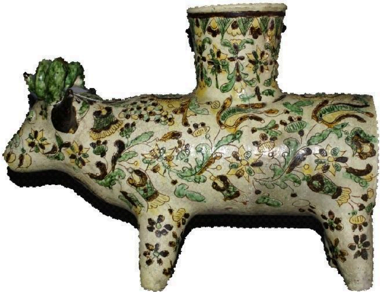
Рис. 19 Баранець-підвазонник. Цвілик П.Й. НМНАГТУ КН-143/158 КС-744 Сер. XX ст. Глина, ангоб, розпис, випалювання.

«серденька», що розташовані поміж ними, надають малюнкові ніжності та невагомості.