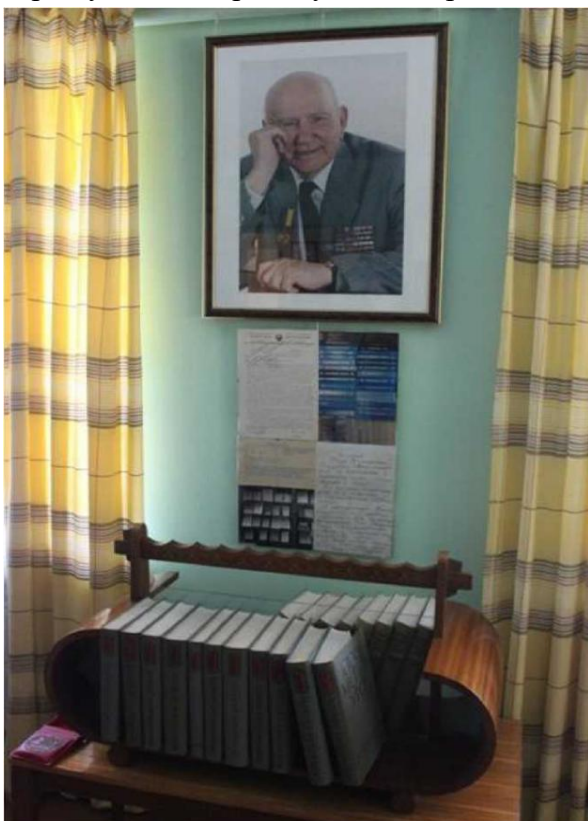
Фото. Видання «Історія міст і сіл Української РСР» в меморіальному музеї академіка П. Тронька в НМНАПУ

Біографічні матеріали, видані науковцями на початку ХХІ століття, дають змогу говорити про невгамовний характер діяча і достатню кількість матеріалів радянського періоду, що компрометують П. Тронька з огляду на «ідеологічну орієнтацію».