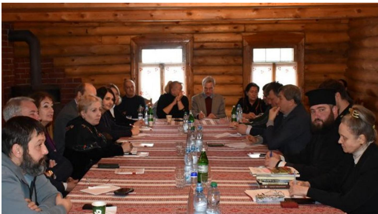
Фото. Засідання оргкомітету. Круглий стіл у Національному музеї народної архітектури та побуту України. 06 лютого 2025 року

6 лютого 2025 року в Національному музеї народної архітектури та побуту України відбувся круглий стіл на тему: «Постать Героя України Петра Тимофійовича Тронька. Гуманітарний дискурс до 110-річчя».