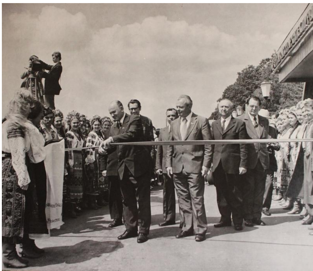
Фото. Відкриття Державного музею народної архітектури та побуту Української РСР. 1976 рік

Національна спілка краєзнавців України відродилася й отримала свій статус під опікою П. Тронька. Почалися великі дослідження, було видано важливі монографії, серед яких монографії з питань теорії і практики історичного краєзнавства, колективна монографія «Репресоване краєзнавство», журнал «Краєзнавство» та інше, проходили всеукраїнські краєзнавчі конференції.