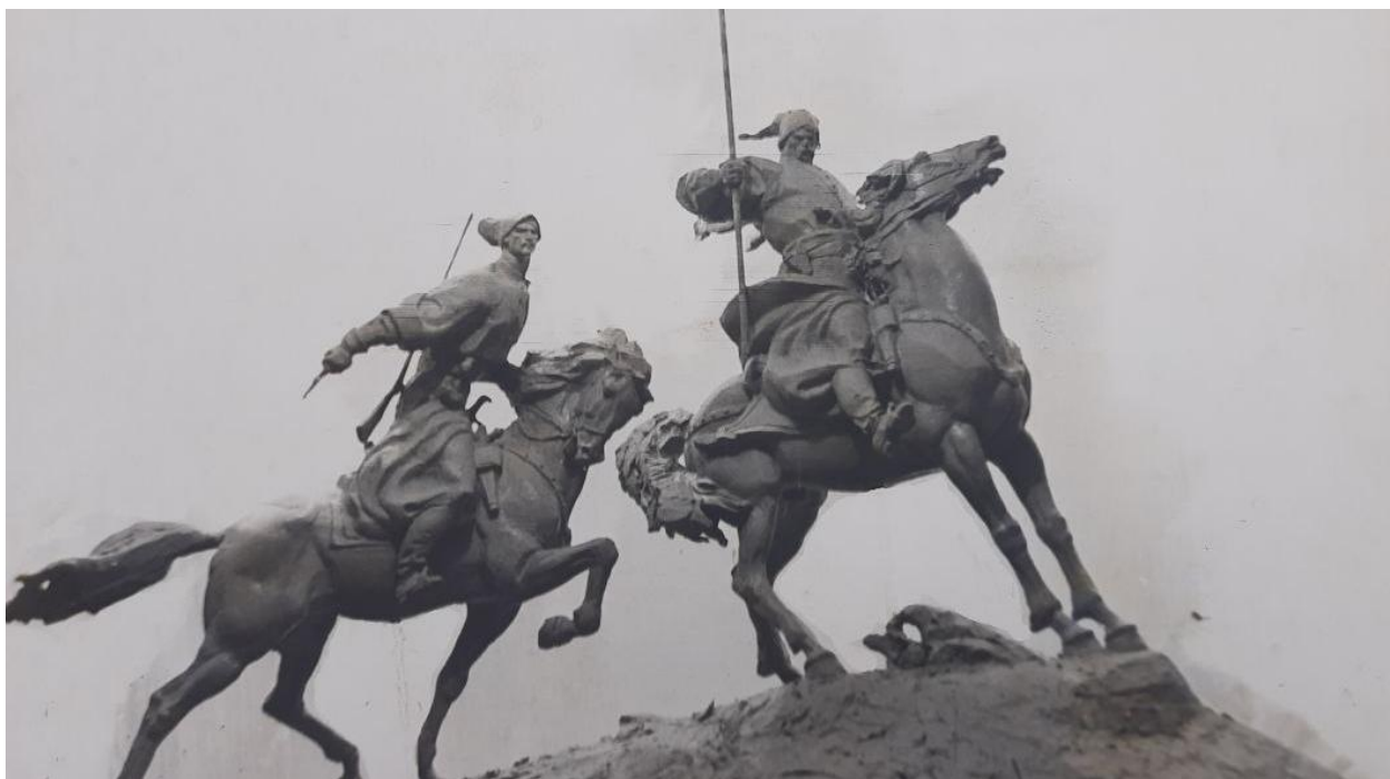
Фото. Проект скульптури «Запорозькі козаки в дозорі». Автор: В. Дубинін. 1968 р.

У тематико-експозиційному плані заповідника належну увагу приділено висвітленню героїзму українського козацтва, а також формам господарювання і соціальних відносин на Запорізькій Січі. Було заплановано побудувати ядро Січі – центральну фортецю, церкву, курені; вали Сагайдачного – реконструйовані залишки укріплень, створені під керівництвом П. Сагайдачного; запорізький табір – рухому фортецю; сторожову; запорізький зимівник – хутір із господарськими будівлями; запорізький гард – спеціальну споруду на річках для риболовлі; ретраншементи – систему фортифікаційних споруд; гавань та верф із чайками; кладовища запорізьких козаків. Також було заплановано спорудити 10-метрову скульптуру «Запорозькі козаки в дозорі».